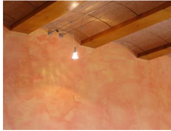
Mise en place d'un enduit mince + patine